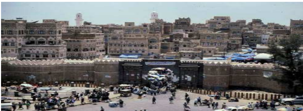
Bab El, Yemen

Em função das restrições técnicas e financeiras, a autoconstrução urbana geralmente tem se restringido a prédios com não mais de três andares. Entretanto, há exemplos na China, Yemen, Mali e muitos outros países em desenvolvimento, onde a tecnologia tradicional de construção e materiais tem sido usada com sucesso em estruturas de seis andares há mais de centenas de anos. As modernas experiências de construção por mutirões em áreas urbanas começam a atingir tais níveis. 8